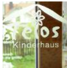
TELOS-KINDERHAUS, Steinreiß 1, 86919 Utting – Holzhausen