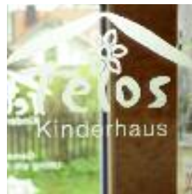
TELOS-KINDERHAUS, Steinreiß 1, 86919 Utting – Holzhausen