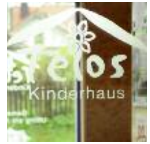
TELOS-KINDERHAUS, Steinreiß 1, 86919 Utting – Holzhausen

Der Container ist mit einem Holzgang mit dem Haupthaus verbunden. Im Container befinden sich